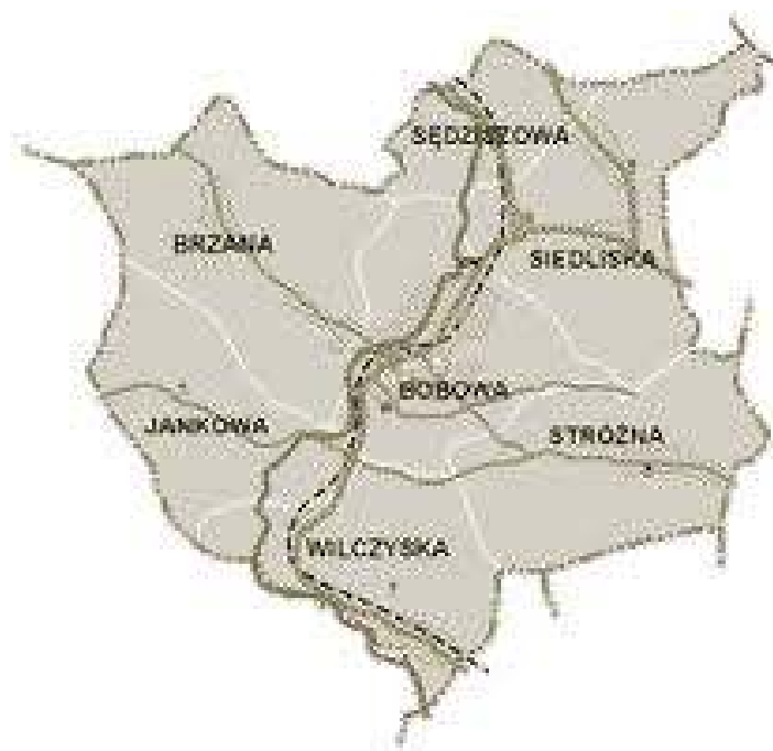
Mapa Gminy Bobowa

Pierwszą informację historyczną na temat miejscowości Bobowa datuje się na rok 1339. Taka data widnieje na przywileju lokacyjnym dla Pawła Benedyka wydanym przez królową Jadwigę. Był to przywilej lokacyjny oparty na prawie magdeburskim. We wczesnym średniowieczu istniał na tym terenie gród, którego ślady można zobaczyć na lewym brzegu rzeki Białej w przysiółku Berdechów. Początki owego grodu archeolodzy datują na XI wiek. Kolejnych