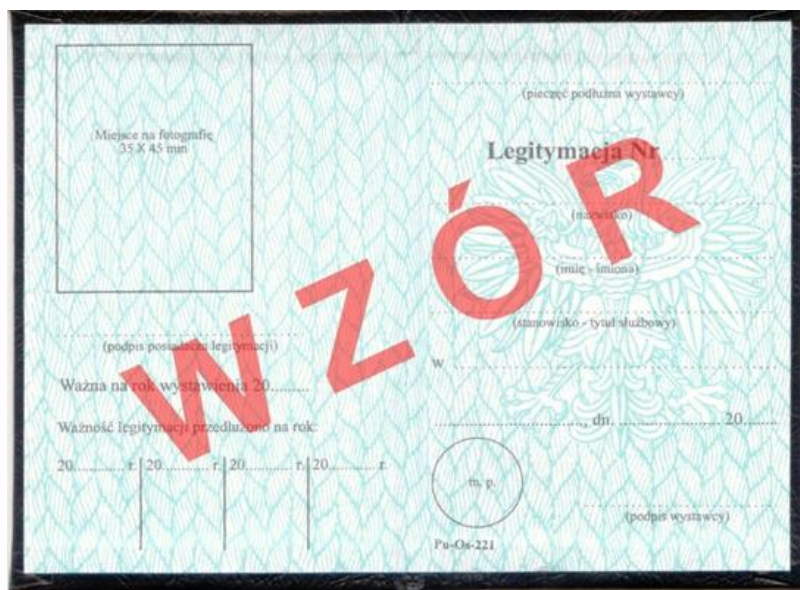
Wzór legitymacji ankietera stałego